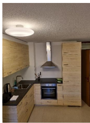
Neue Küche im Aktivierungsraum