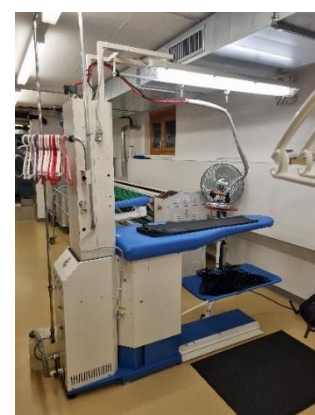
Bügelstation in der Wäscherei